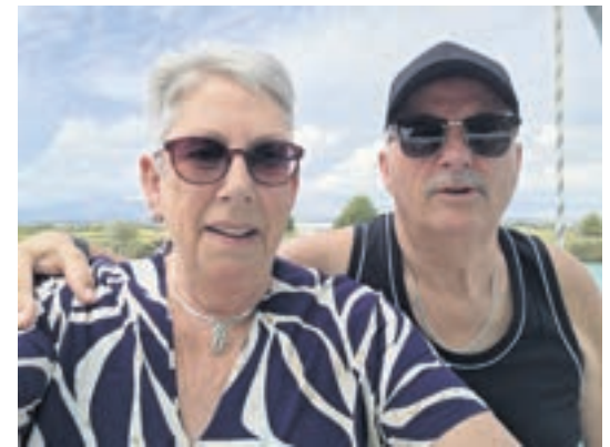
Binnenkort volop vrije tijd