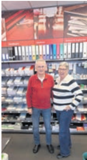
Nu nog volop aan het werk